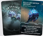
1 FROSTRIESEN- MONSTERARTEFAKT