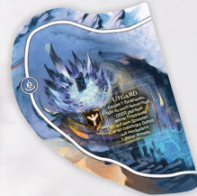
1 REICH-PLÄTTCHEN FÜR DAS SPIEL ZU ZWEIT