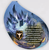
1 REICH-PLÄTTCHEN (UTGARD)